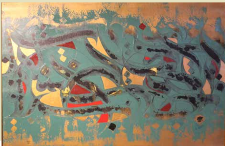
فائق خالدی / دبیر هنر از سندج