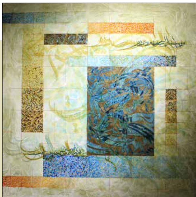
الهبیار خوشبختی / مرکب کالیگرافی، ورق طلا