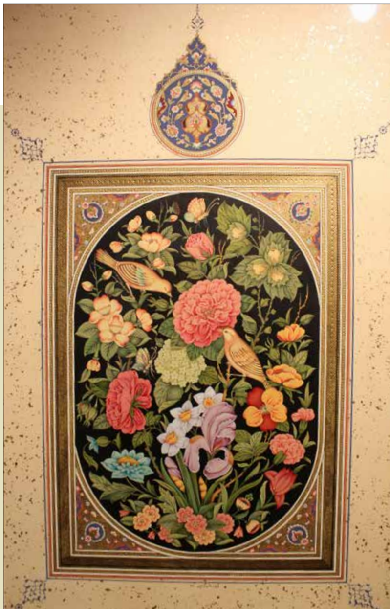
آزاده شوش پور