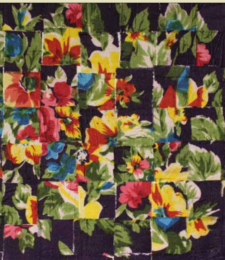
فهیمة ابراهیمی / کلاژ پارچه روی بوم بازیافت